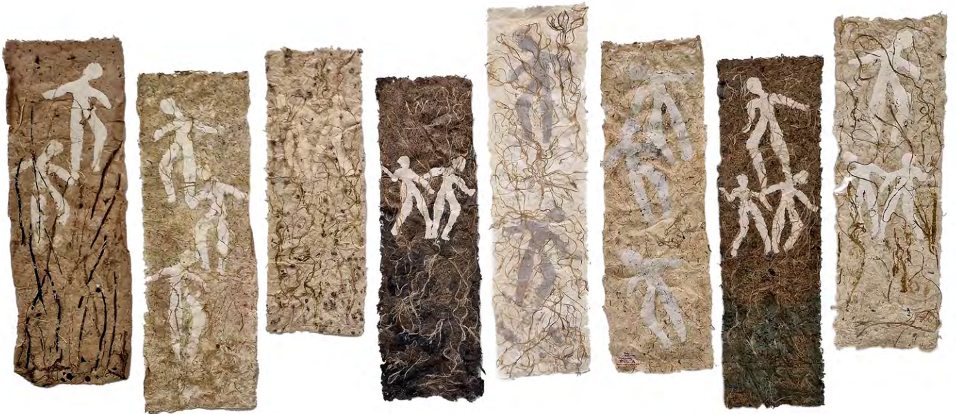
Grans caminants entre textures , 2022. Instal·lació de vuit textures realitzades amb plantes variades i paper reciclat. 180 x 200 cm