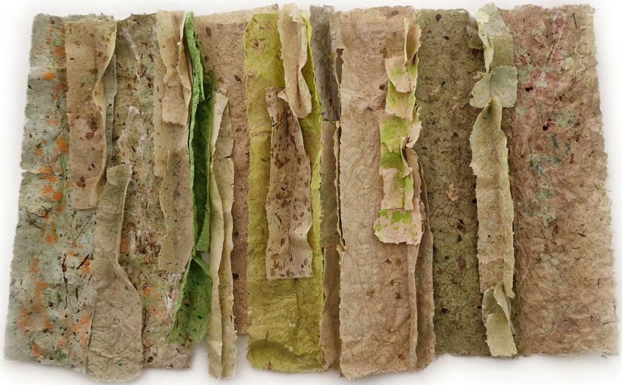
En cascada , 2021. Instal·lació retroil·luminada. 140 x 200 cm