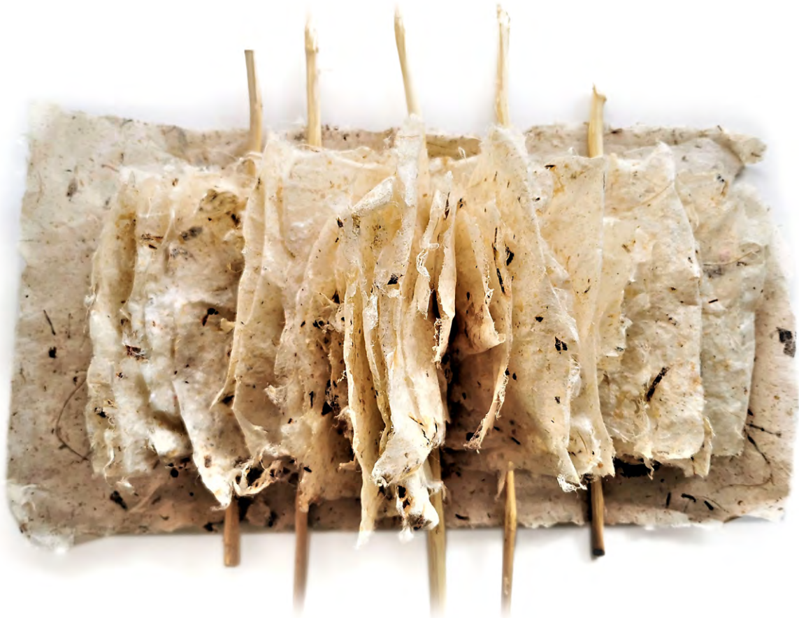
Llibre instal·lació II , 2020. Fibres liberianes de baladre i palets de morera sobre tela. 60 x 50 x 15 cm