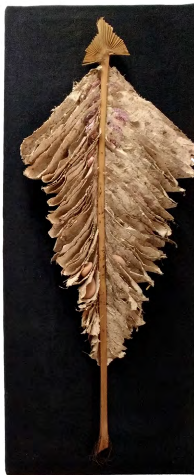
Personatges , 1993. Tríptic amb paper fet a mà, peduncles de margalló, petxinetes i cudols. 120 x 150 cm