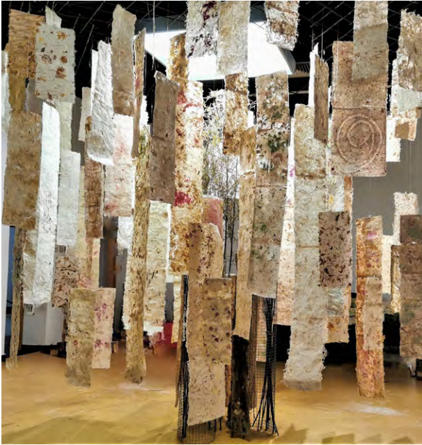
Bosc màgic , 2021. Mides variables