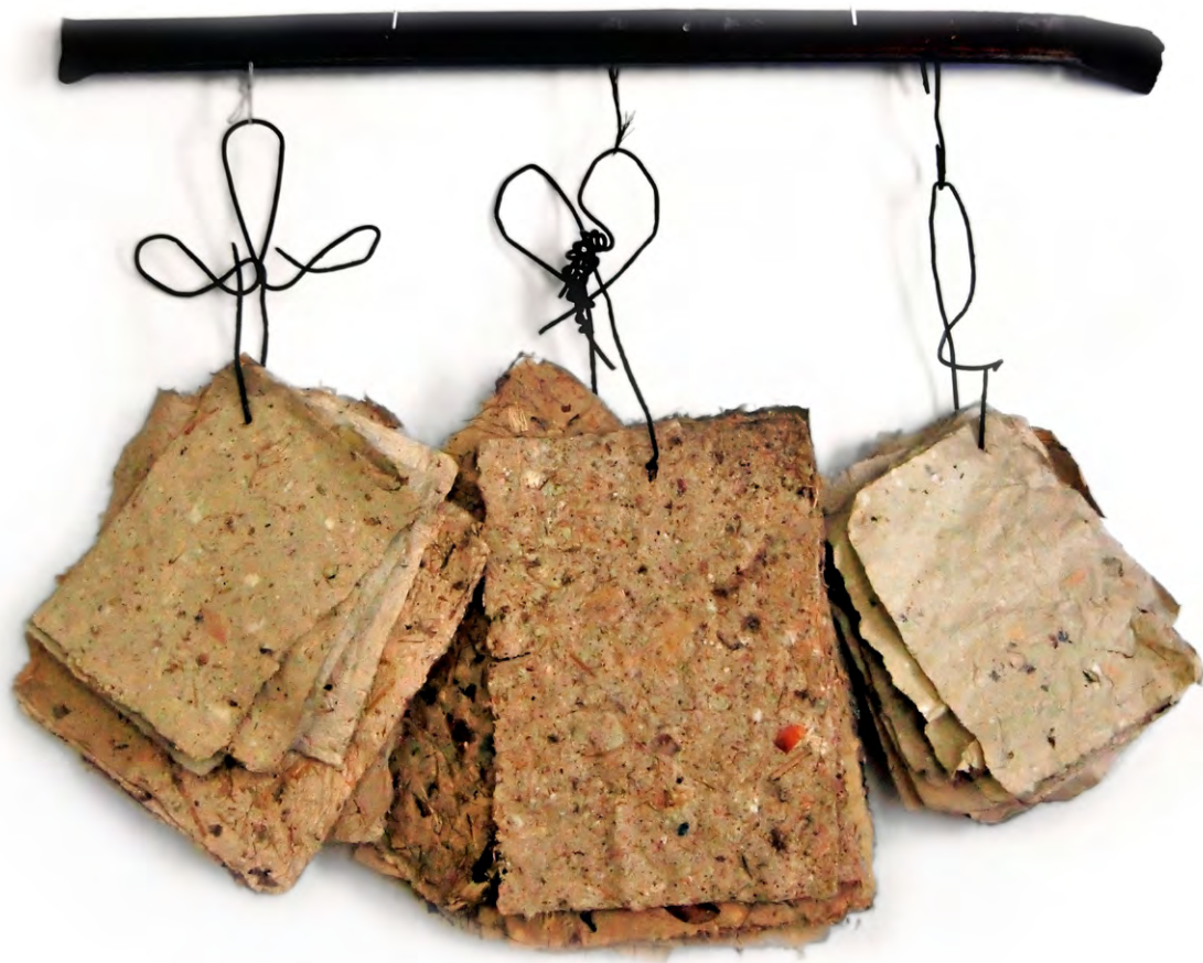
Records , 1994. Instal·lació amb ferros trobats i papers reciclats artesanals. 42 x 55 x 15 cm