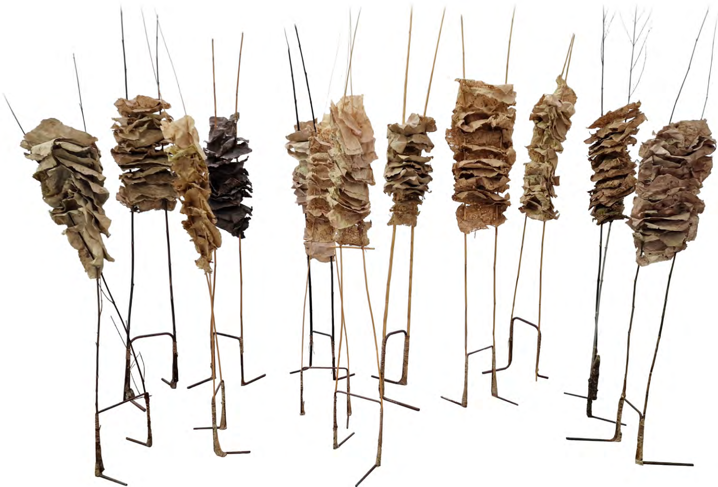
Fragilitats , 1994. Instal·lació de paper fet a mà amb vegetals, ferros trobats, canyes i bambú. Mides variables