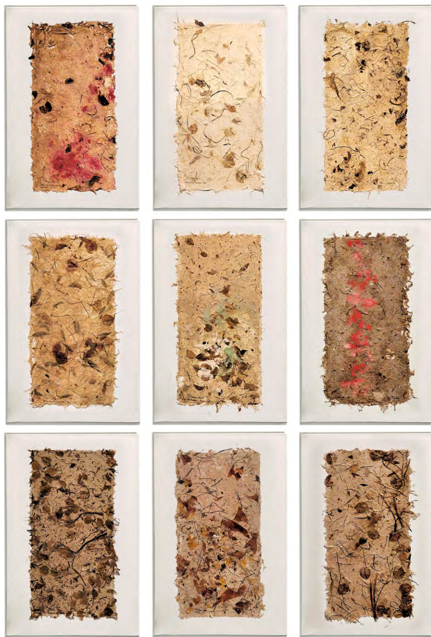
S/T, 2020-21. Textures vegetals sobre tela. 60 x 40 cm