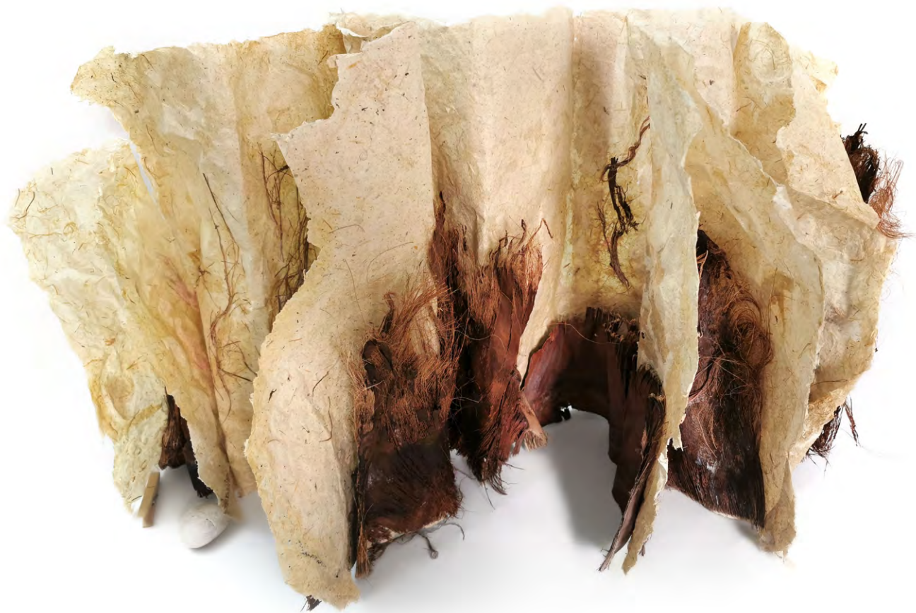
Història d'una palmera que va nèixer en un lloc inapropiat , 2018. Llibre escultura, paper de gramínies silvestres i teixit de soca de palmera. 50 x 85 x 40 cm