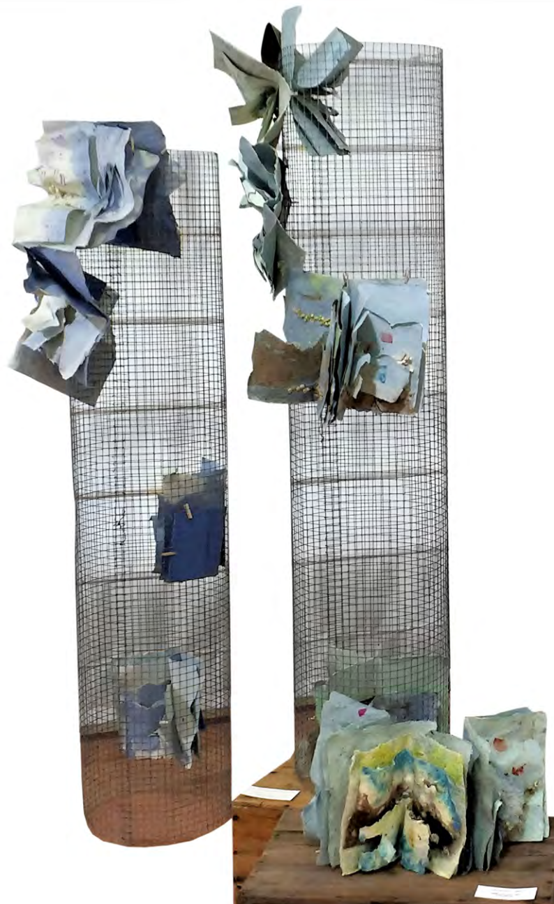
Llibres lliures , 2016. Instal·lació amb quadernets de paper-art sobre columnes metàl·liques. 120 x 60 x 65 cm