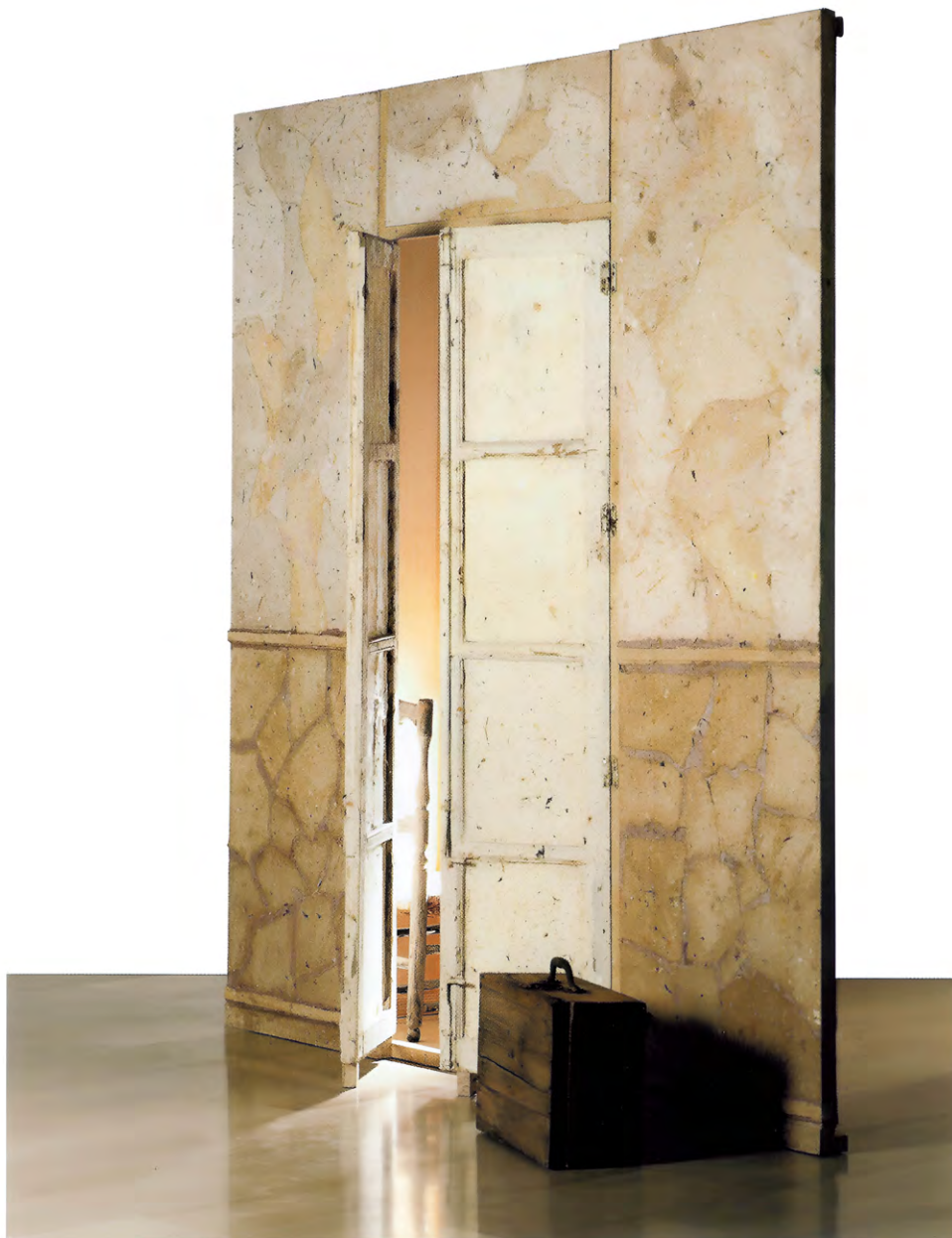
Dualitat , 1999. Instal·lació. 210 x 200 cm