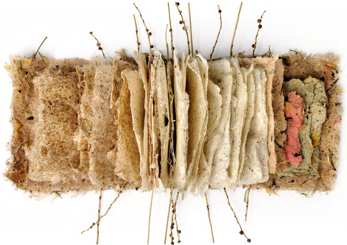
Llibre instal·lació I , 2020. Paper fet a mà amb fibres liberianes de móra i altres textures i branquetes de dàtil sobre tela. 60 x 50 x 15 cm