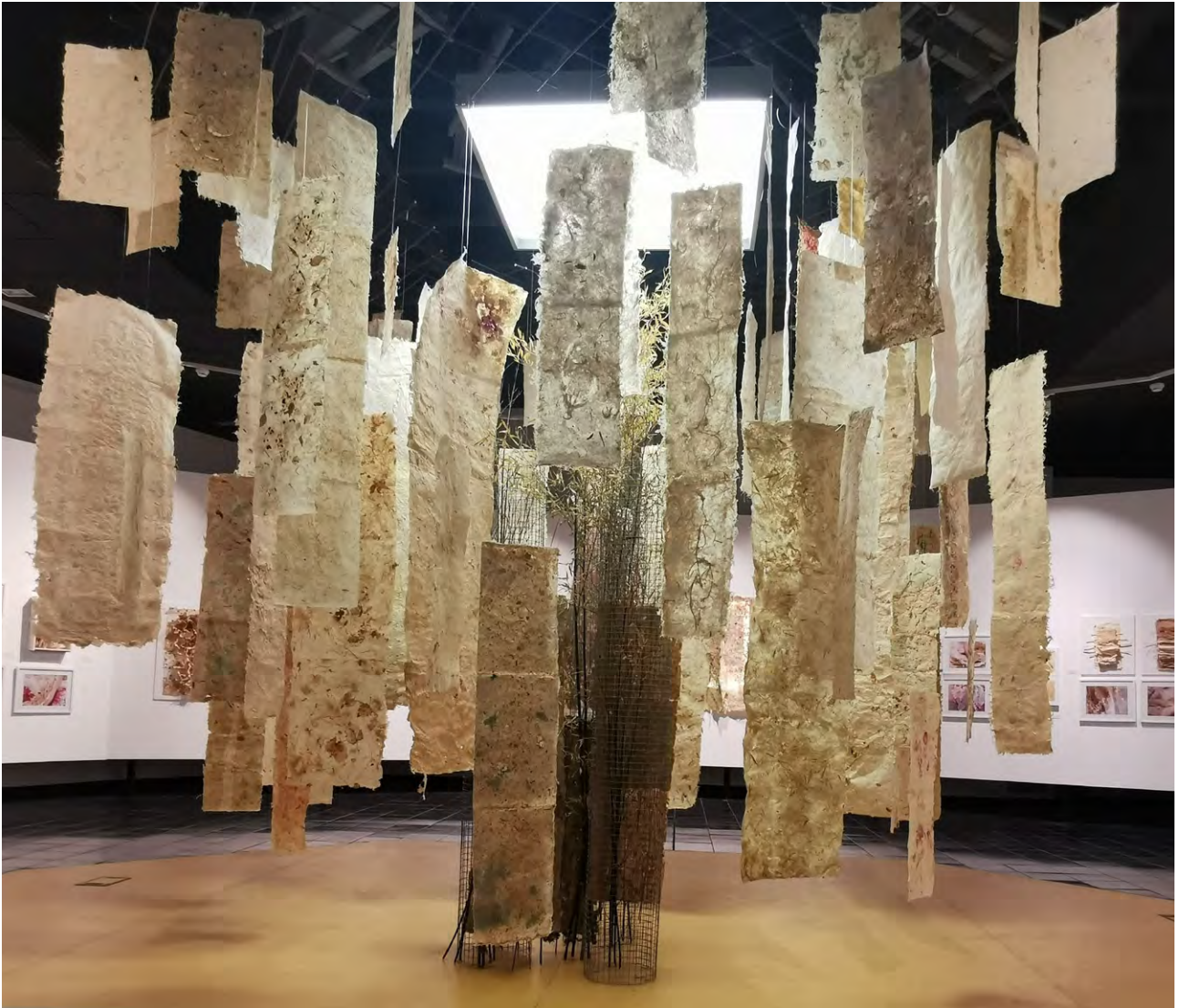
Bosc màgic, 2021. Mides variables