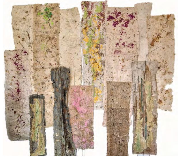
Textures màgiques , 2022. Instal·lació de papers artesanals realitzats amb plantes, vímet i polpes acolorides. 250 x 300 cm

Per a continuar aprofundint en el nostre discurs expositiu plantejarem ara un altre missatge: el de transmissors de pensaments i inquietuds de l'artista pel viatge de l'ésser humà a través del temps. Això em recorda la peça Dualitat (1999), una de les obres més suggeridores de la sala. En aquesta l'artista ha dissenyat una porta falsa que amaga diverses metàfores entorn del viatge. La primera és la necessitat de l'ésser humà d'eixir fora, per a conèixer el món i ampliar els seus coneixements. Reforçant aquest missatge, una maleta secundada contra la porta preparada per a una nova aventura. Però després existeix un altre viatge per al qual no necessitem equipatge. O almenys no material. És aqueix viatge cap a dins, la necessitat de l'autoconeixement. I per a aquest viatge interior els objectes simbòlics estan representats amb una cadira i un llum. La primera ens convida a asseure'ns i a