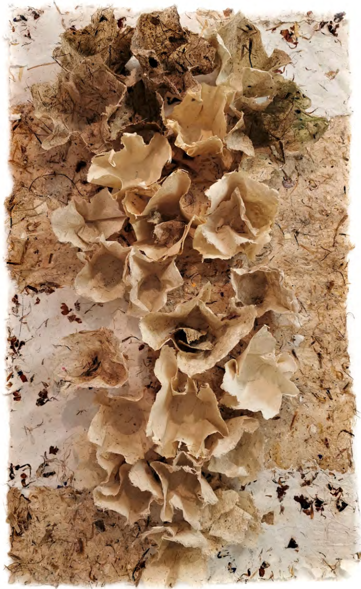
Estructures sobre collages, 2021. Textures vegetals de palmera, gramínies, plàtan i cotó. 100 x 80 cm