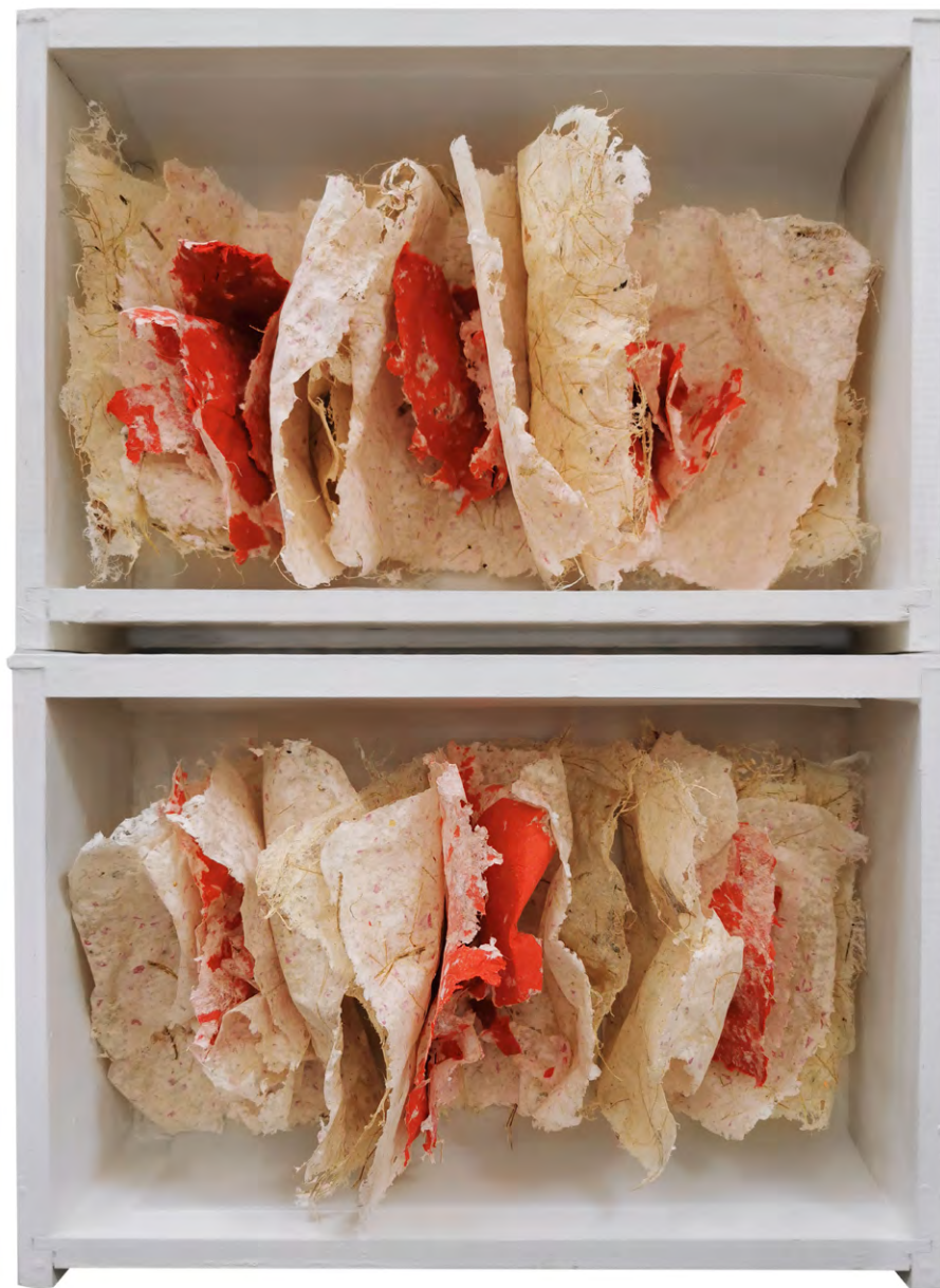
Màgia roja , 2021. Instal·lació de paper artesanal i calaixos recuperats. 70 x 40 cm