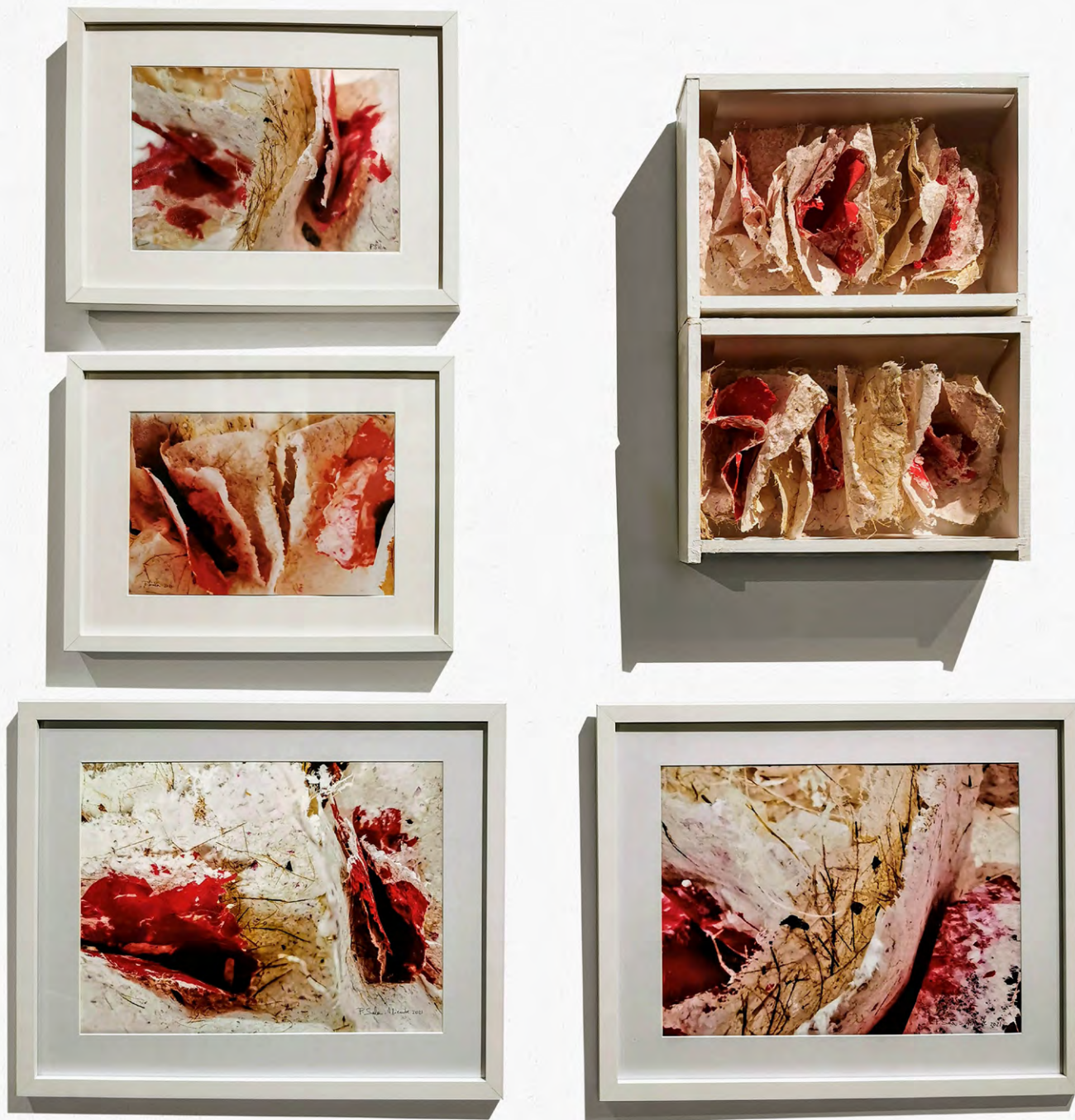
Màgia roja , 2021. Instal·lació amb textures amb barreja de iuca, palmera, abacà i paper reciclat vermell, introduïdes en dos petits calaixos. 70 x 40 cm