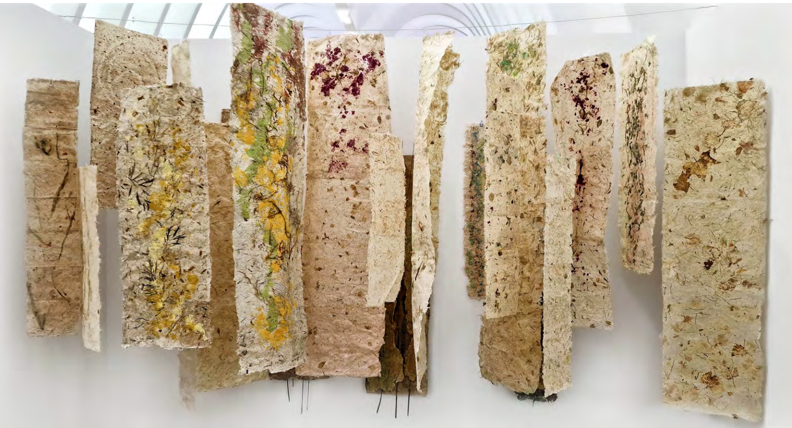
Textures màgiques , 2022. Instal·lació de papers artesanals realitzats amb plantes, vímet i polpes acolorides. 250 x 300 cm