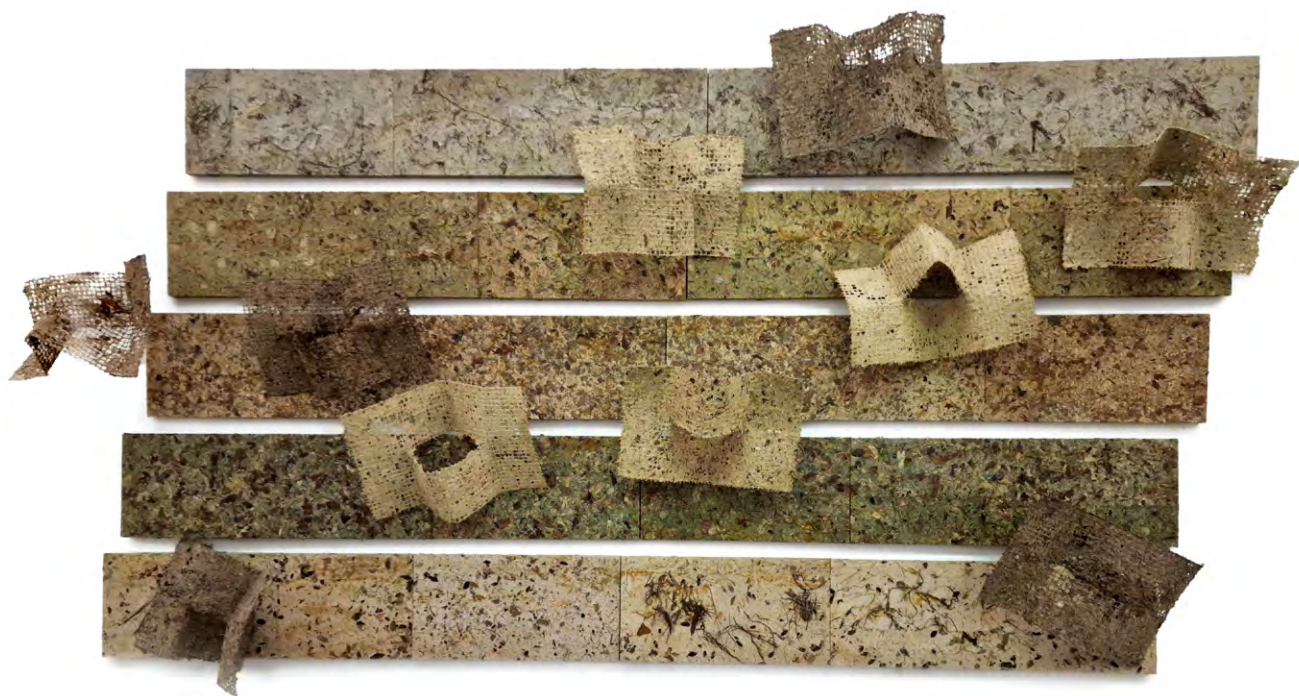
Les notes, com papallones i paraules al vent , 1996. Instal·lació amb textures vegetals sobre fusta i tela metàl·lica. 250 x 400 cm